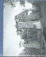
Le vieil ascenseur à bateaux Henrichenburg, Waltrop