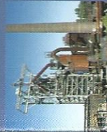
L'Usine sidérurgique Henrichshütte Hattingen