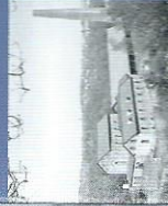
La mine de charbon Nachigall (Rossignol), Witten