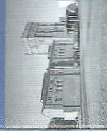
La mine de charbon Hannover, Bochum