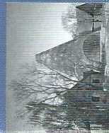
La verrerie Gemheim, Petershagen