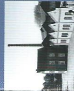
Le musée textile Bocholt