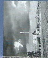
La briqueterie Lage